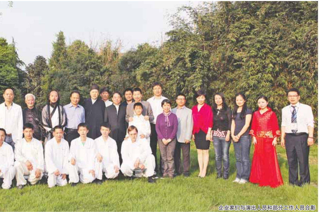
企业家与通威人员及部分工作人员合影