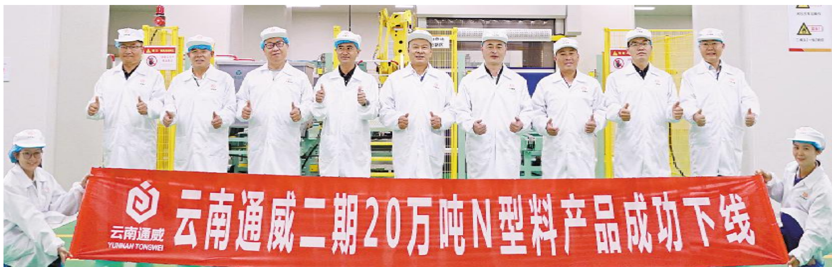
云南通威二期 20 万吨 N 型料产品成功下线