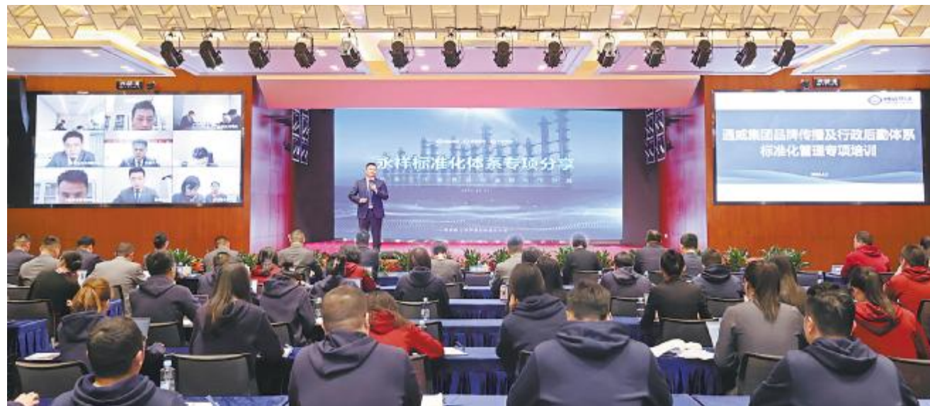
永祥标准化体系专项分享