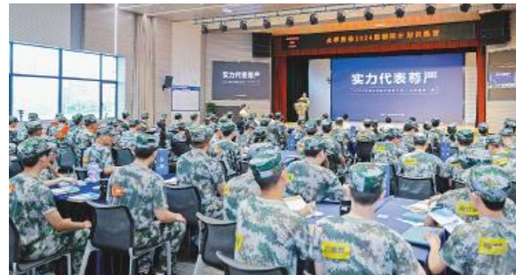
2024 届朝阳计划启动仪式现场

今年上半年,永祥股份分层级、分阶段,有计划的开展人才培养和团队建设,为总经理等高层管理者量身定制的领航计划、综合提升部长级中层管理者管理能力的远航计划,上半年开展方案拟定工作;系统学习生产管理,提升管理能力的启航计划共开展6期培训,314名工段长参加;朝阳计划引进160名应届大学生,通过集中培训,师带徒、定期评级等方式系统培养。同时,各公司启动年度技工等级评定工作,参评人数突破5000人。各公司每季度进行一次五星工段评选,每月定期开展红旗班组评比,形成常态化机制,提升班组自我管理能力和提高工段长高效执行能力。一线员工严格按照6阶段培训方可转正,确保员工“0误操作”。