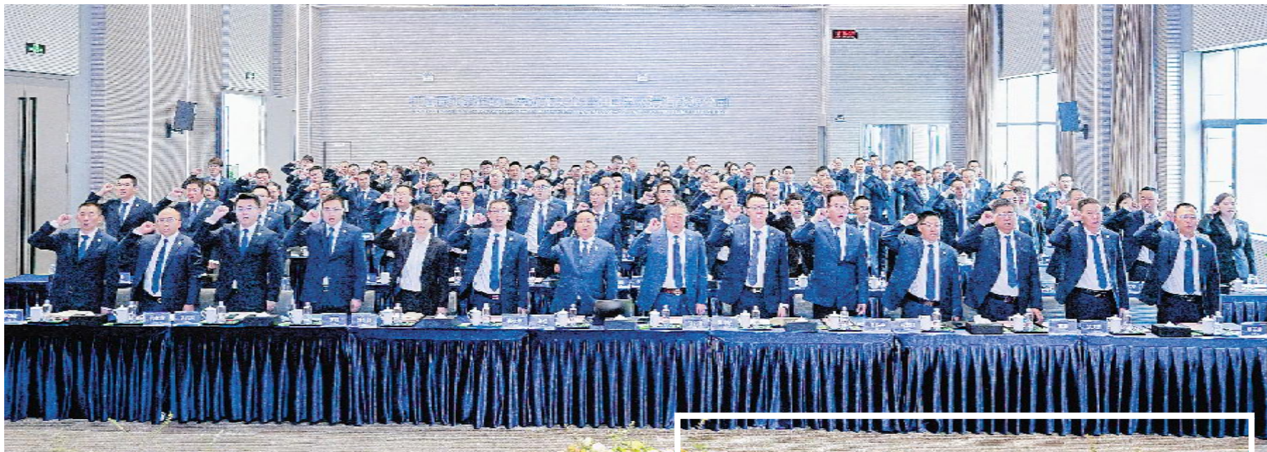
永祥股份 2024 年度管理提升会现场