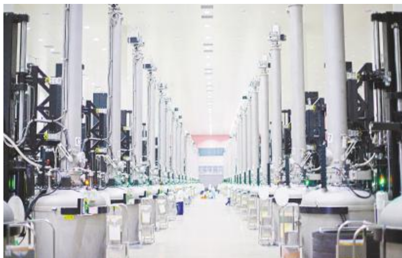
永祥光伏科技生产车间

中国电子材料50强企业,以及相关电子材料专业十强企业的核准及发布,旨在扶持一批具有国际竞争力和行业带动性强的电子信息材料企业,促进我国电子材料行业技术创新和转型升级。评选经过各专业委员会和行业内推荐、企业申报、数据收集与处理、评议及审核等工作程序,是第一个电子材料行业的企业经营业绩及发展潜力综合评价