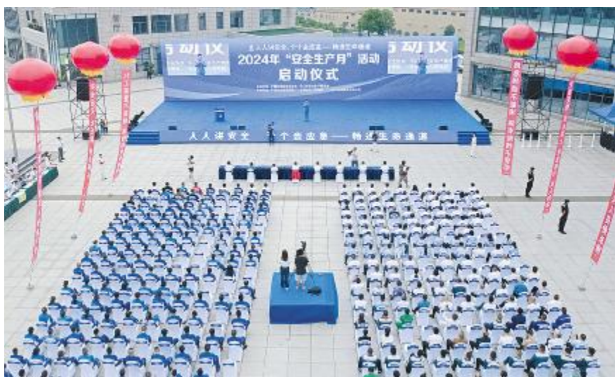
乐山市 2024 年“安全生产月”活动启动仪式现场

遵照刘汉元主席指示,确保客户价值最大化,实现公司持续稳定健康发展,永祥股份修订完善了质量方针和目标,并以此为契机,公司规范全员意识和行为,今年上半年,开展全员质量方针宣贯。品管部先后深入包头基地、广元基地、乐山基地、保山基地开展质量监督检查;并组建售后团队,打通产业链信息流、数据流,对产品质量和结构进行分析、搭建,形成统一的售后管理机制。今年上半年,永祥股份各公司生产N型料占比超过90%,内蒙古通威、永祥多晶硅分别在重要客户中质量排名第一,客户满意度高达97.86%。