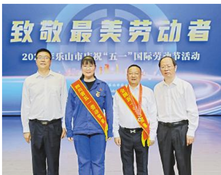
2024 年乐山市庆祝“五一”国际劳动节活动现场