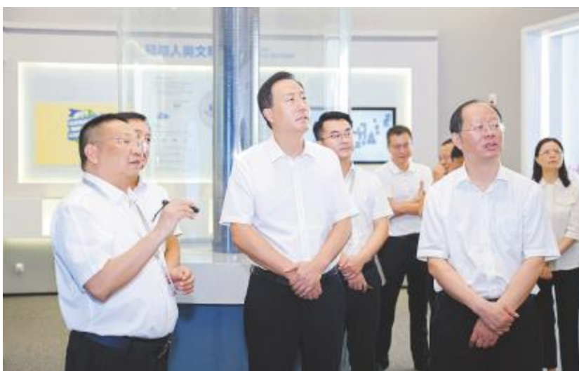
乐山市委书记赵波参观永祥数字体验中心

在永祥数字体验中心,赵波书记对永祥的产业布局、发展历程、生产运营等情况进行全面了解,对企业生产成本、工艺技术创新等工作表示关切。李总对赵波书记一行表示热烈欢迎,对市委、市政府的关心、支持与帮助表示感谢,并表示,永祥深知技术是企业发展的核心驱动力,高度重视技术研发、不断夯实技术基础,创新平台建设和技术团队培养,成立了国家级企业技术中心、省多晶硅工程技术研究中心、高纯晶硅制备工程实验室、博士后创新实践基地。在冷氢化、反歧化、高效还原等技术领域,永祥不仅实现了从无到有的突破,更创造了拥有自主知识产权的600多项研究成果。当前,市场正处寒冬,永祥逆势而上,形成了四川乐山、四川广元、内蒙古包头、云南保山四大生产基地,不断推动中国绿色硅谷“产业链、创新链、人才链”三链互动,以实际行动,持续推动中国新能源产业的绿色转型与高质量发展。