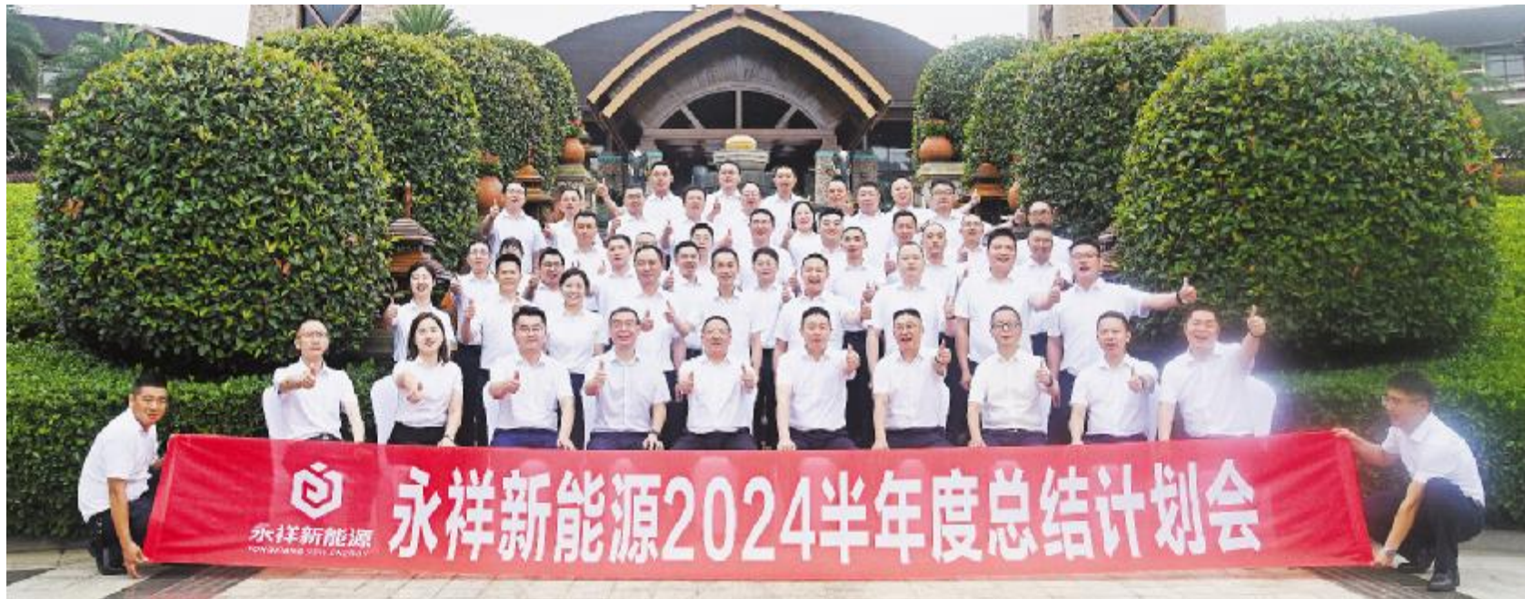
永祥新能源 2024 半年度总结计划会合影留念