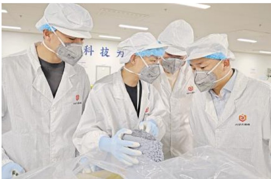
永祥股份品管部赴内蒙古基地质量监督检查现场