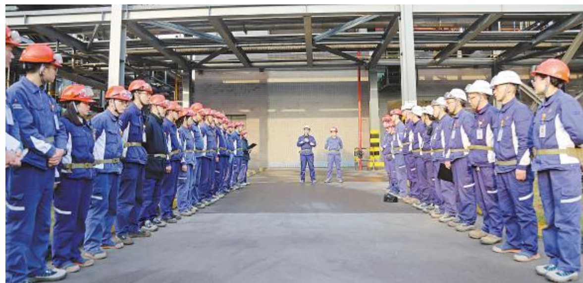
永祥标准化宣讲现场

展望未来,李总表示,永祥的目标是持续推动技术创新和管理提效,朝着打造世界清洁能源公司和高纯晶硅龙头企业,坚定前行,为能源转型和“双碳”目标贡献永祥力量。