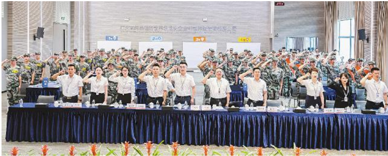
2024 届朝阳计划开营仪式现场