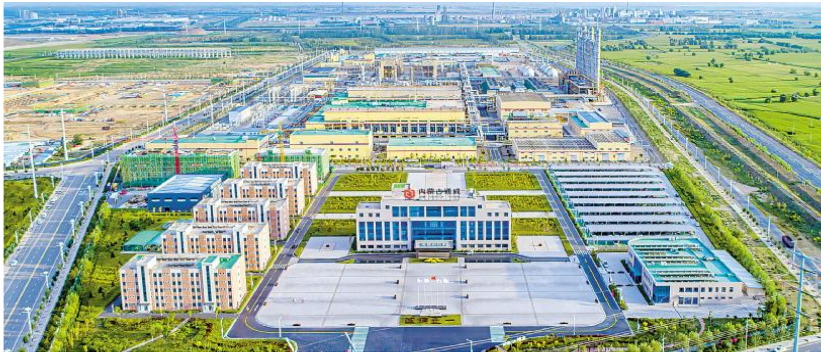
内蒙古通威绿色厂区

简单即是伟大,单一才能做精、做专、做强!而标准化建设,就是将复杂的问题简单化,模糊的问题具体化,分散的问题集成化,成功的方法重复化,从而实现各项工作的有机衔接!