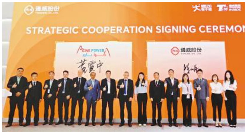
ACWA POWER & 通威股份战略合作签约仪式现场