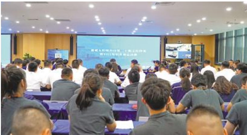
通威太阳能科技 EHS 知识竞赛总决赛盐城基地现场

浪必答题、争分夺秒抢答题、勇攀高峰风险题、安全领导力一战到底擂台赛和一决胜负五个环节。在必答题环节,选手们沉稳应对,回答每一个问题,充分展示了对 EHS 知识的深刻理解。抢答题环节,现场气氛紧张刺激,选手们的掌声和欢呼声此起彼伏。风险题环节,选手们根据自身实力和风险承受能力,选择不同分值的题目,为团队争取更多分数。而一战到底环节更是彰显了各基地部门负责人安全领导力。