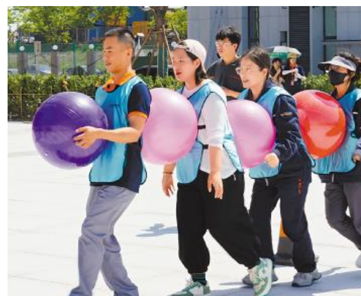
“砥砺前行”跑步赛,齐心协力向前冲