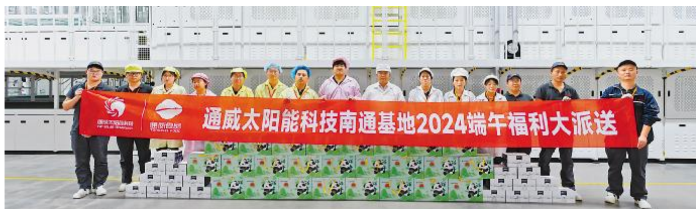
端午福利大派送南通基地合影留念