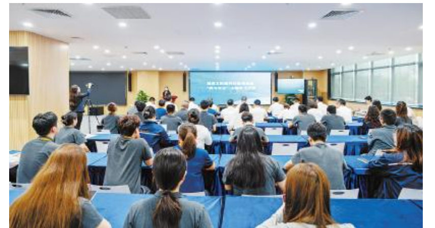
通威太阳能科技盐城基地“我与安全”主题征文活动决赛现场

决赛现场,各部门涌现出的10位优秀选手分别进行汇报演讲,通过评委现场打分,决出了公司级一、二、三等奖和特等奖,并进行了颁奖表彰。以此次活动为切入点,盐城基地将在各部门推广开展一系列形式多样、内容丰富的活动,做到“安全意识覆盖全员,应急技能全员普及”,提升员工风险防控、安全操作、自保互保等能力,推动公司及各单位的安全生产工作。