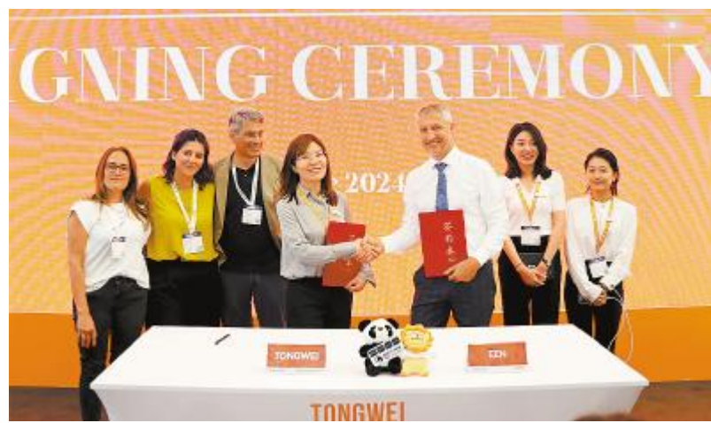
通威与 ENN 签署战略合作协议

威的热情与魅力。现场气氛逐渐升温, 欢呼声、掌声此起彼伏。通威 TNC-G12/G12R “茶话会”同步开启, 通威与来宾面对面交流, 探讨通威组件的高效性能和应用场景, 进一步加深与会嘉宾对通威组件的了解。