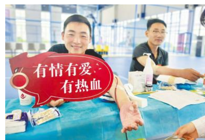
爱心献血,有情有爱有热血