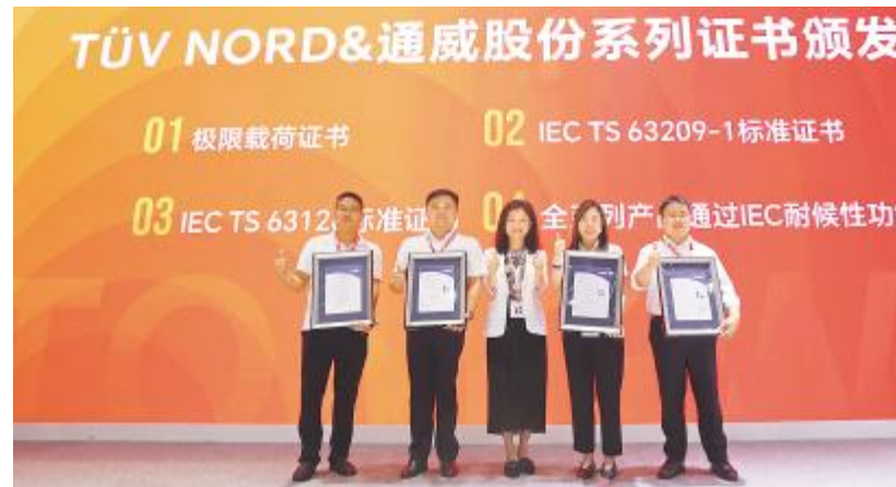
TUV NORD & 通威股份系列证书颁发仪式现场