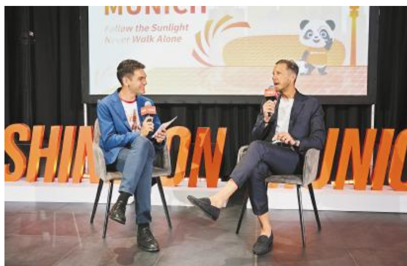
通威“足球光伏之夜”晚宴, 前 AC 米兰队长马西莫·安布罗西尼作分享

晚宴上, 通威之友身着通威球衣, 一同观看欧洲杯精彩赛事, 见证通威在光伏领域的成长与成果, 享受美食与音乐的双重盛宴。前 AC 米兰队长马西莫·安布罗西尼向嘉宾们分享了对足球的热情以及对团队协作重要性的见解, 表达了对可再生能源特别是光伏行业的关注与支持。安布罗西尼表示, 就像在足球比赛中一样, 光伏产业也需要团队合作和激