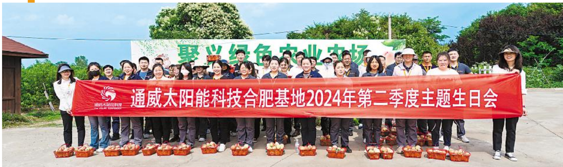
通威太阳能科技第二季度员工生日会合肥基地合影留念