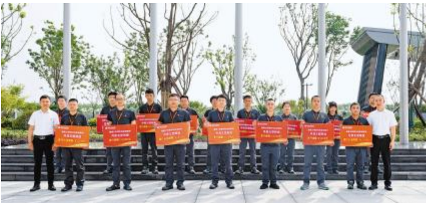
通威太阳能科技5月五型班组表彰活动盐城基地现场

进入6月,奋战号角再起。通威太阳能科技以决战决胜的姿态,多措并举,聚合力,强动力,添活力,为高质量发展蓄势赋能。当前,全年已过半,更要坚定信心,以敢拼敢闯的精神落实攻坚,抓紧每一天、紧扣每一项指标,压实责任,集中精力主攻重点工作,全力以赴抓生产经营,以实干拼搏的行动夺取全年目标任务的全面胜利。