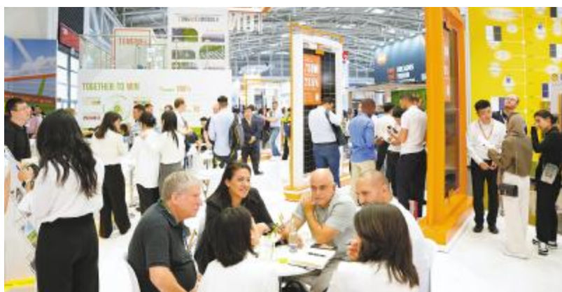
客户了解通威高效组件