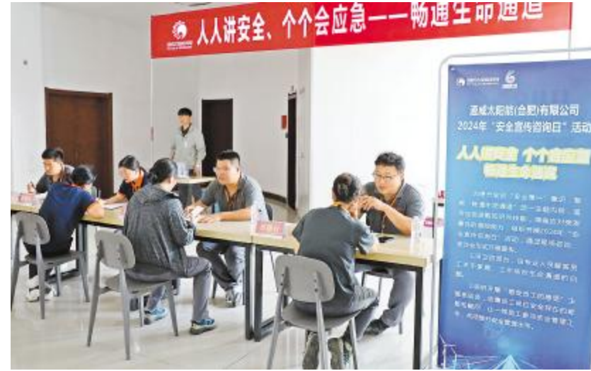
通威太阳能科技安全宣传咨询日合肥基地活动现场

专业安全管理人员全程为员工们提供一对一的咨询解答服务,针对实际工作中遇到的安全问题,给予了详细的指导和建议。参加活动的员工纷纷表示,将持续紧扣“安全生产月”活动主题,落实各项安全要求,时刻将“安全第一”谨记心中。