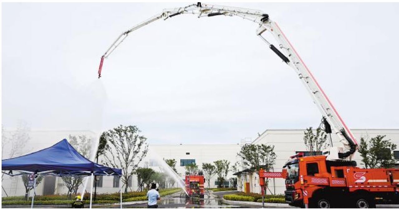
通威太阳能科技盐城基地举行危险化学品应急救援演练