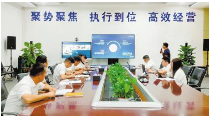
通威太阳能科技第二季度“中心TQM项目”评审会合肥基地评审现场

评审会不仅是对项目奖金进行评定,也是相互深入学习和推广的平台,更是激发创新和思想交流的重要途径。