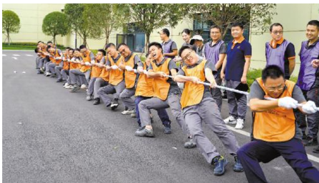
“凝心聚力”拔河比赛,团队协作大比拼

此次趣味运动会不仅增强了员工之间的团队合作精神,同时也为大家提供了一个放松身心、增进交流的平台。未来,通威太阳能科技工会将继续开展健康向上、丰富多彩的员工活动,不断提高员工的获得感和幸福感。