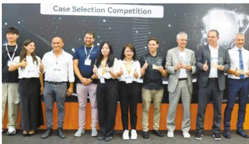
通威海外光伏组件案例评选大赛颁奖仪式成功举行

的联动。颁奖仪式共揭晓通威太阳能案例精英奖 6 名、通威太阳能案例卓越奖 10 名, 以表彰合作伙伴的创新应