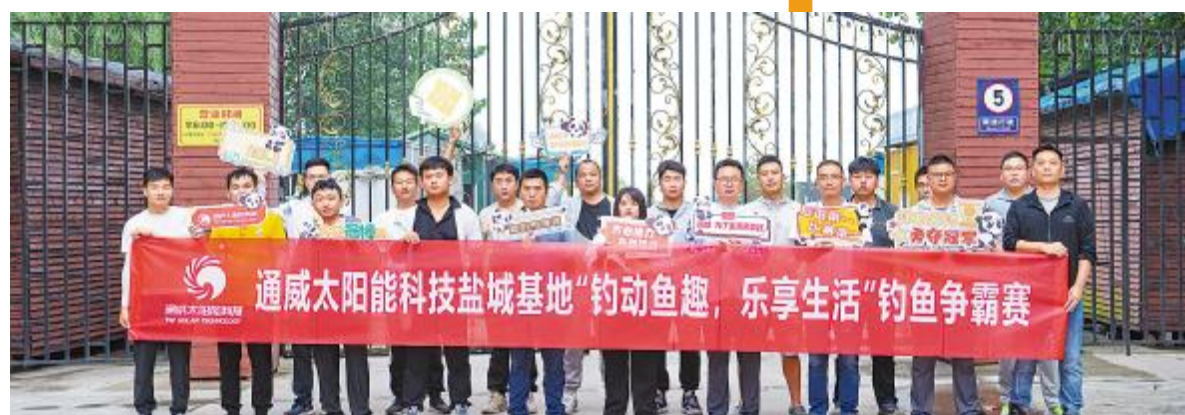
通威太阳能科技盐城基地钓鱼比赛合影留念