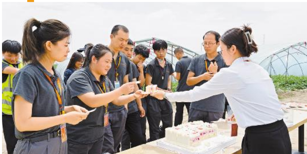
员工生日会同享幸福

参赛员工纷纷表示,感谢公司组织的这次比赛,今后将以更加饱满的精神状态和更大的工作热情投入到本职工作中,共同为公司发展贡献力量。