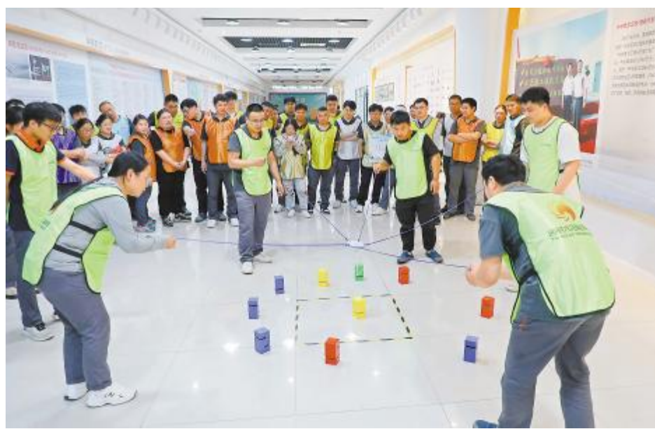
“力创新高”搭积木赛,默契配合迎挑战