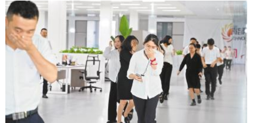
通威太阳能科技金堂基地开展疏散逃生演练

应急小组结合演练表现,对存在的问题进行了分析,纠正了错误动作,讲解了疏散逃生时需要注意的事项,强调了消防安全演练的必要性和重要意义。同时,应急联络中心成员现场介绍了消防应急柜和疏散引导箱内的应急物资,就公司内部配备的多种灭火器进行了详细讲解,并邀请员工们进行亲身体验。此次疏散逃生演练活动,提升了员工们的火灾应对能力和自我保护意识。