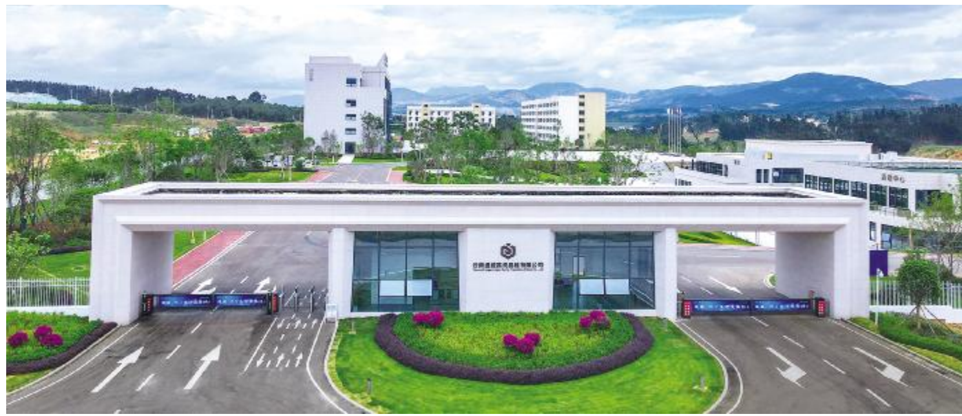
云南通威花园式工厂