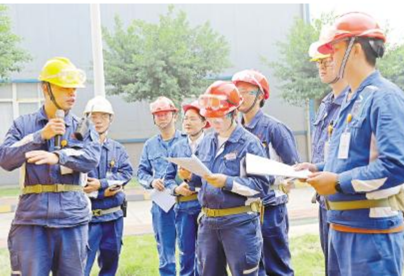
永祥多晶硅抽查员工方案掌握情况

坡的时候,也是体现甲乙双方负责人精品工程意识的时候。要强化双方属地负责人的责任心、施工匠心,高效建设安全工程、精品工程。施工单位要不断提升质量意识、规范意识,将现场建设班组培训落到实处,持续强措施、严考核,确保标准方案落地不走样。冲刺四季度,高质量建设是头等大事,所有参建人员要团结一致、精准施工、强化安全,持续抓进度、提速度、强质量、促安全、保节点,坚决按计划完成装置交付,为全面实现二期项目精品工程安全高效建成投产共同努力。