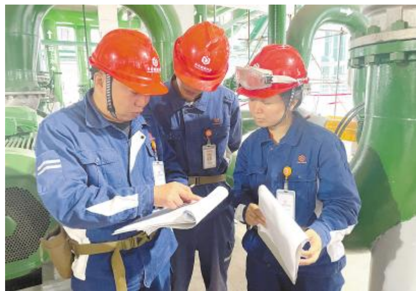
永祥能源科技开展总经办领导现场JCC检查