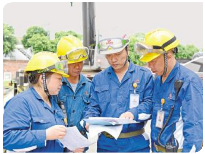
做精做细做实每一件小事