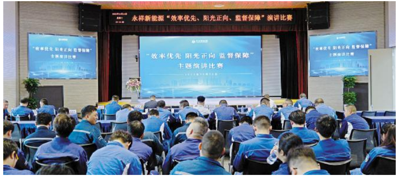
永祥新能源举行“效率优先 阳光正向 监督保障”主题演讲比赛