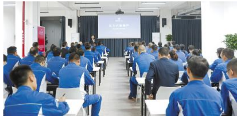
广元通威绿材开展总经理第一课

陈总强调,无论是国家、企业还是个人,有实力才会有尊严!大家应树立正确的人生准则,调整心态,才能在辛苦工作的时候更有动力,在取得成绩的时候更有激情,所有成绩的取得都需要坚守和付出。希望每一名新员工在加入永祥之初就能直观看到、了解到公司的管理思想,抓住公司大发展的优质平台,制定正确的职业规划,切实落实公司管理方针,成长为公司的栋梁之材。