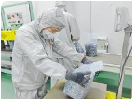
认真专注,保障产品质量

在实现“双碳”征程中,永祥人始终秉持“通威,为了生活更美好”的愿景,扎根平凡岗位,敬业奉献,用坚守与付出,坚定推进晶硅阳光事业,为留住蓝天白云、青山绿水贡献积极力量。