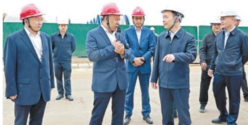
云南省政府副省长、党组成员张治礼一行莅临云南通威视察

10月24日,云南省政府副省长、党组成员张治礼莅临云南通威视察。保山市政府常务副市长杜春强,昌宁县长范正建等陪同。永祥股份