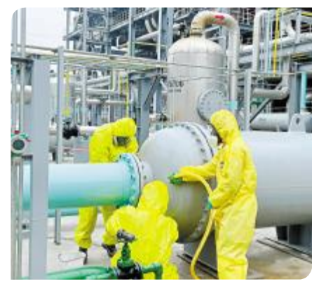
日常演练,保障安全

身其中,不断提升工艺水平,推动绿色可持续发展。我们将坚守岗位,全身心地投入到这个伟大事业中,为实现碳达峰碳中和贡献自己的一份力量。中国梦就在前方!让我们更加紧密地团结在一起,为建设绿色、美丽中国作出更大贡献。