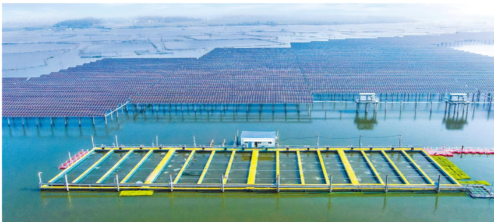
通威泗洪“渔光一体”基地