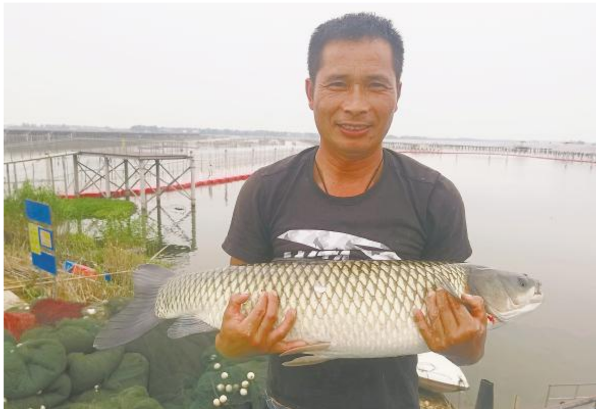
“渔光一体”基地喜丰收