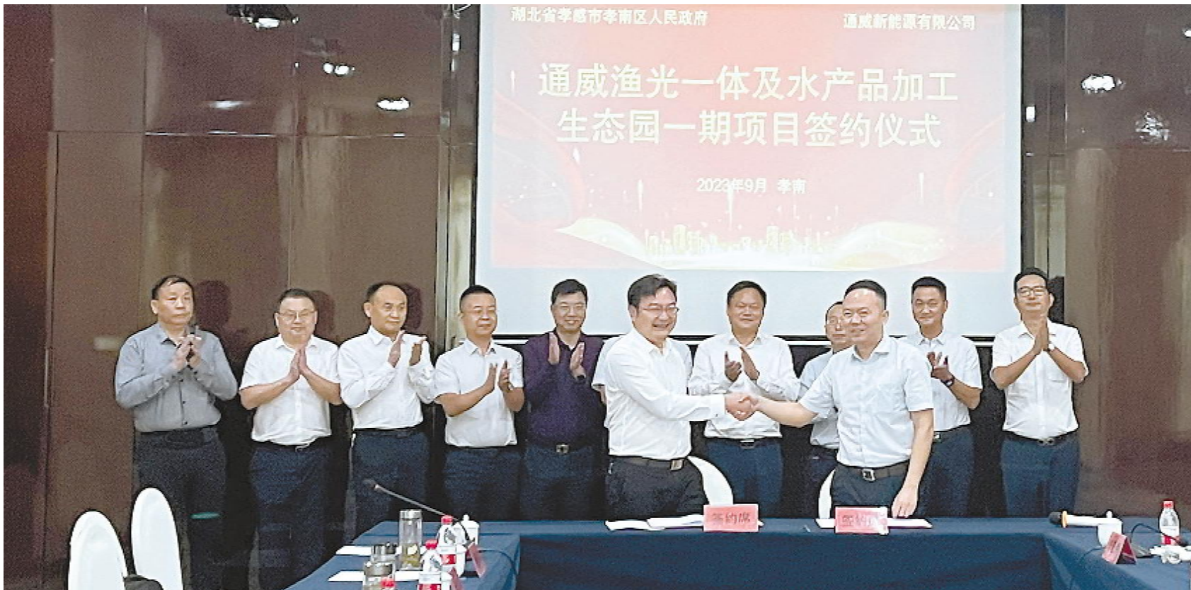
通威新能源直属业务与湖北省孝感市孝南区人民政府成功签约

表决是形成公司意思的基本方式,表决方式违法当然产生决议效力的瑕疵。表决方式瑕疵包括无表决权人表决、议案未经表决、未达多数决比例、非真实意思表示四类。