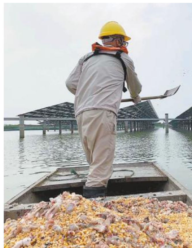
坚守岗位,细心喂食