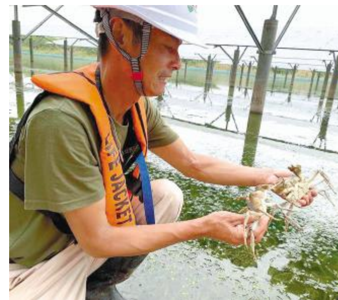
“渔光”大闸蟹黄满膏肥