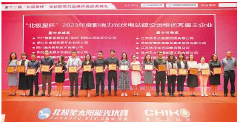
渔光物联荣获“北极星杯”2023年度影响力光伏电站建设运维优秀雇主企业之星光卓越奖

源宣贯廉洁专题会表示感谢,并表示,随着通威新能源业务不断壮大,项目决策复杂化,公司面临新的挑战,全体干部及员工在思想上、行为上要牢固树立和践行正确的价值观,必须时刻警醒自己,克己守欲,践行“诚、信、正、一”经营理念,为公司和个人的持续健康发展打下坚实基础。希望各级干部员工积极配合集团监察工作,共同推进廉洁文化建设,打造风清气正的经营氛围。