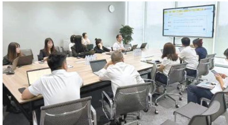
通威新能源开展新技术推广应用管理办法宣贯会

近年来,孝南区始终坚持农业农村优先发展,区级分管领导对相关数字农业开展实地考察,并详细了解现代化农业转型升级发展情况,通过全流程服务,推动该现代农业综合体项目正式落地,加强农业科技推广,有效扩大数字现代化农渔业规模,使孝南现代化农渔业得到高质、高效发展。