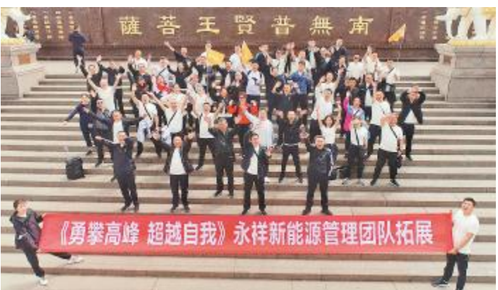
永祥新能源举行管理团队拓展活动