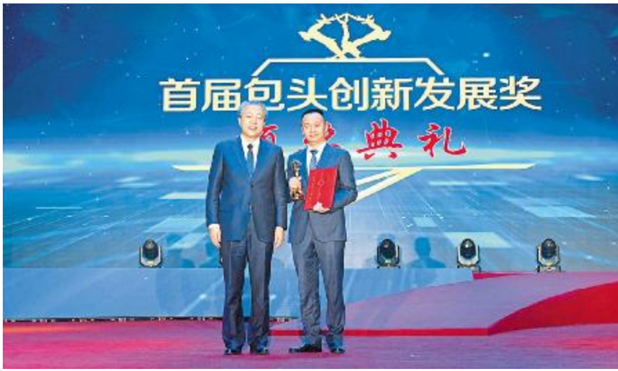
内蒙古通威荣获首届包头创新发展奖