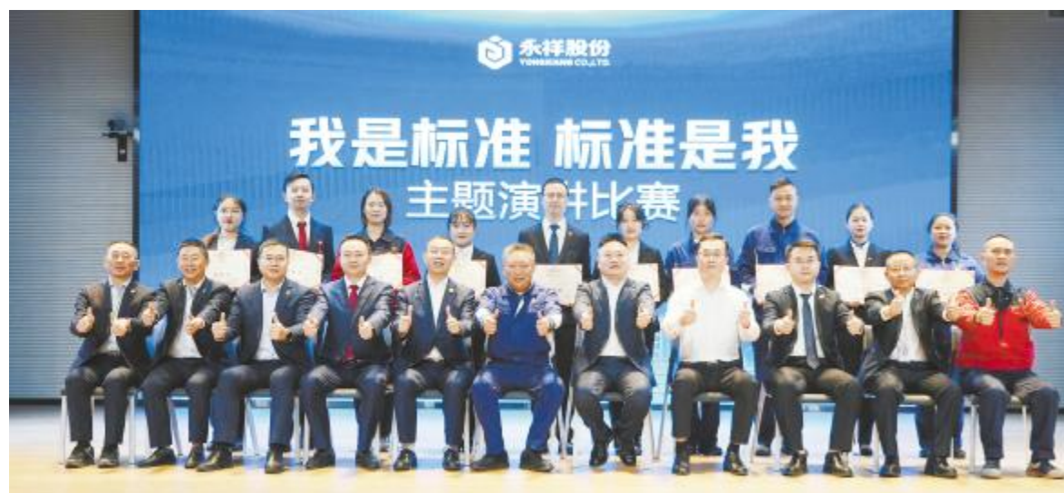
永祥股份“我是标准 标准是我”主题演讲比赛合影留念