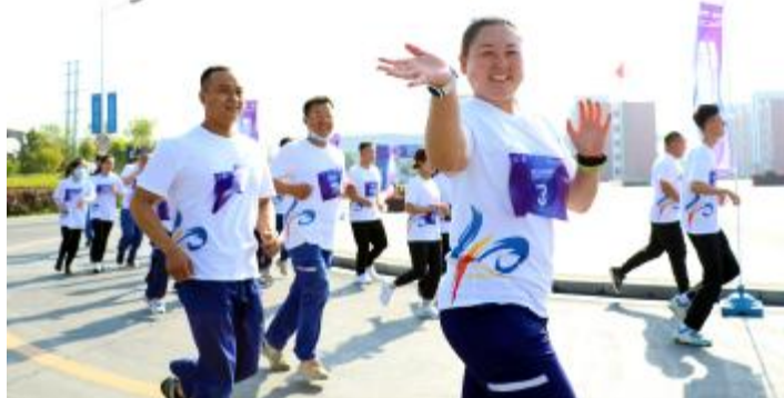
内蒙古通威举行通威40年庆追光健康跑活动