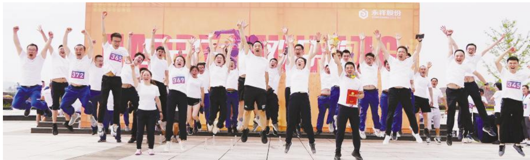
永祥股份举行“520”欢乐跑