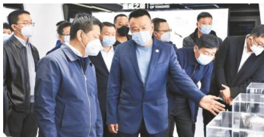
共青团云南省委副书记赵攀峰莅临云南通威调研

2022年12月12日,四川省政协民族宗教委员会主任顾勇莅临永祥股份调研。乐山市政协副主席周鸿雁,五通桥区政协主席陶红陪同。永祥股份副总经理易继成,永祥股份总经理助理代宏热情接待。