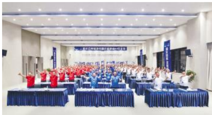
云南通威观看通威40年庆典暨“大干100天·再上新台阶”大会直播