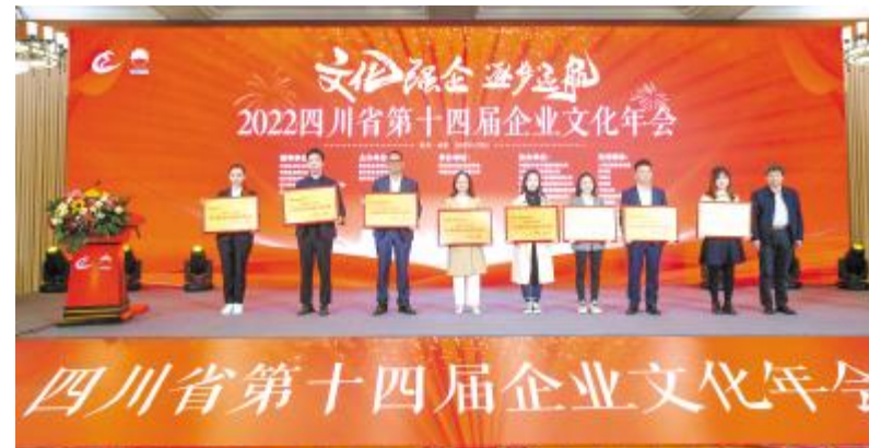
永祥股份荣获“四川省企业文化建设先进单位”称号