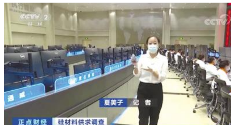
央视财经《正点财经》栏目聚焦报道内蒙古通威