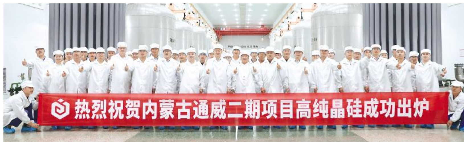
2022 年 7 月 11 日,内蒙古通威二期项目高纯晶硅成功出炉