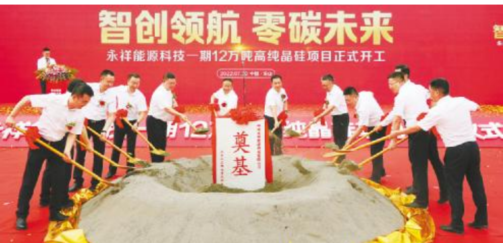
2022 年 7 月 30 日,永祥能源科技一期 12 万吨高纯晶硅项目正式开工