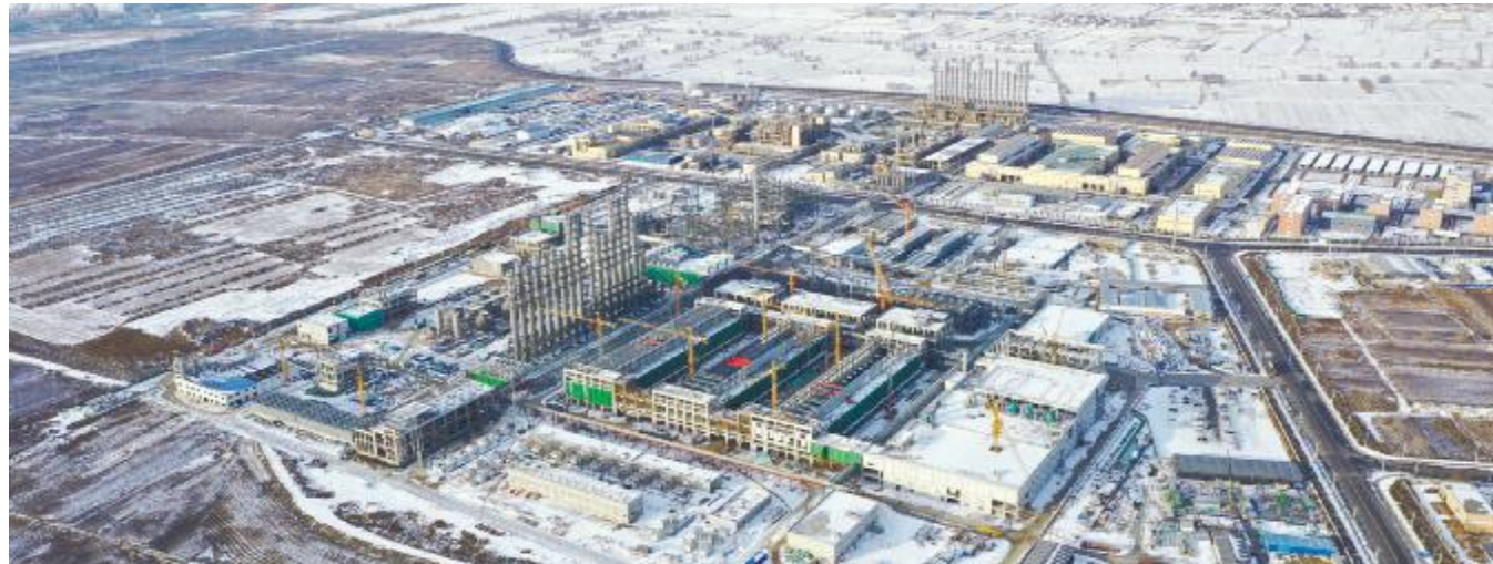
2月初,内蒙古通威二期克服严寒天气抓紧推进项目建设

生产部、安环部狠抓安全生产,安全管理专业人员到属地开展安全检查,针对装置运行、产品处理等重点工作进行排查和专项优化;设备动力部组织人员对现场仪表、管路进行专项