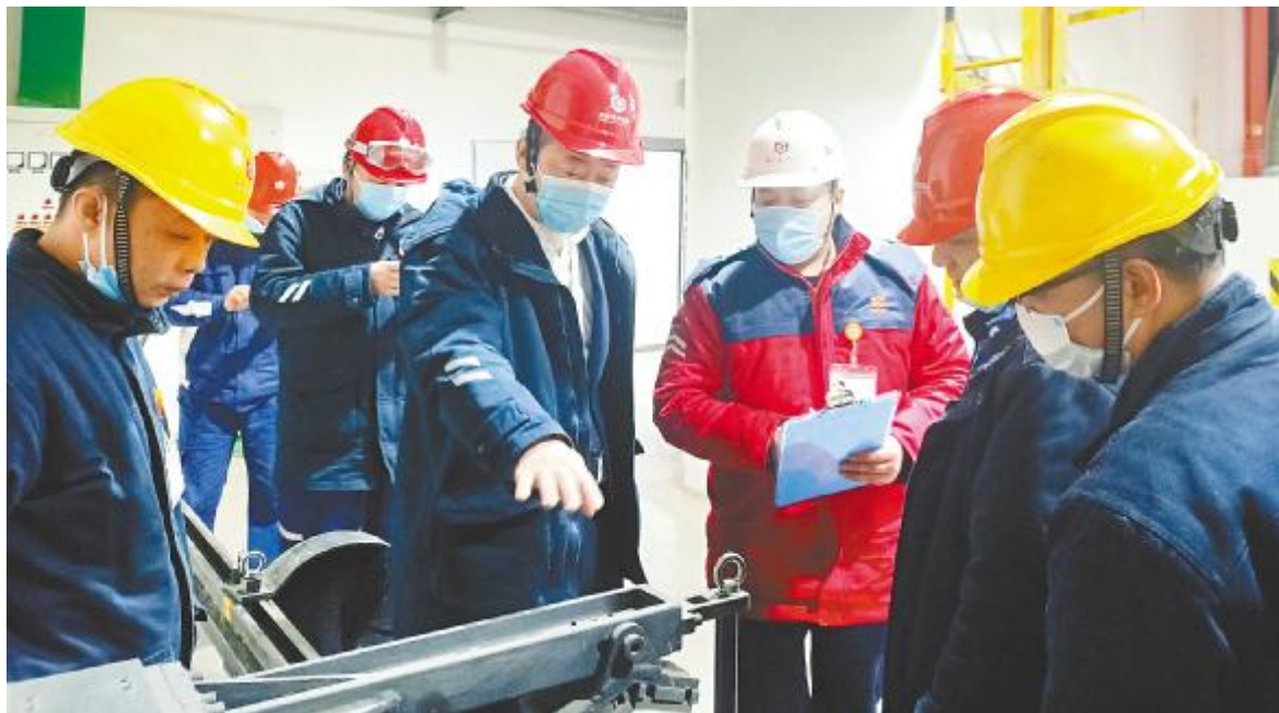
永祥光伏科技硅棒分部开展安全生产综合检查