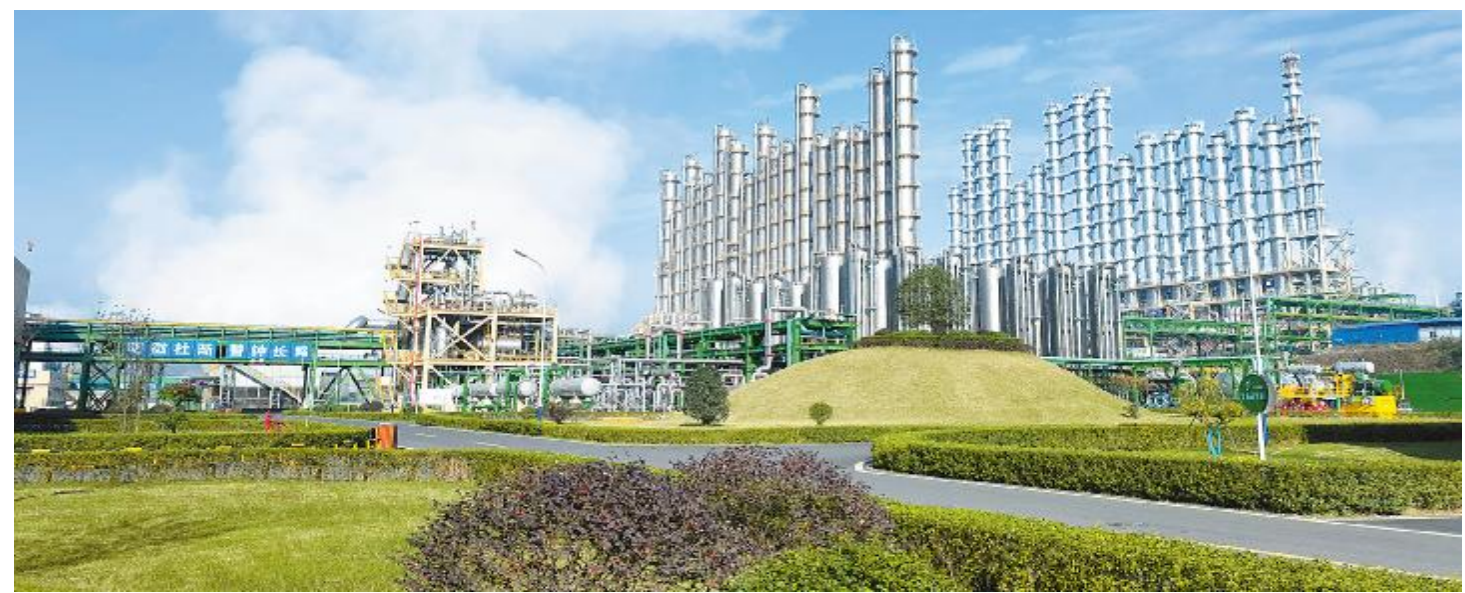
永祥新能源绿色厂区

于高山之巅方见大河奔流,于群峰之上更觉长风浩荡。实力代表尊严,只有不断往前奔跑,才能见到更多别人无法企及的风景,梦在远方路在脚下光在心中,2022年,光伏科技每一个人都将做到自愿、自主、自发,在新的一年里全新启航,朝着我们的经营目标全力以赴,将我们真挚的希望点亮,将光伏科技打造成通威又一张靓丽名片!