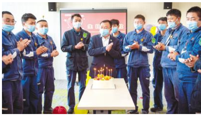
云南通威举行2月员工生日会