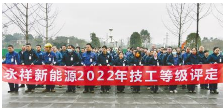
永祥新能源举行2022年技工等级评定考试