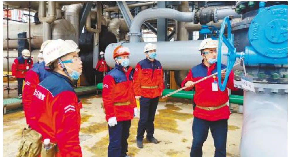
永祥多晶硅开展节后复工安全大检查