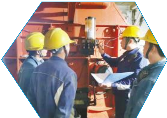
永祥新材料商砼开展设备维护保养

在安全大检查中,各公司的检查组强化隐患排查,全覆盖、不留死角,对发现的问题做到真抓真改,并将对整改事项进行“回头看”,以此形成闭环管理,切实将安全隐患消灭在萌芽状态。