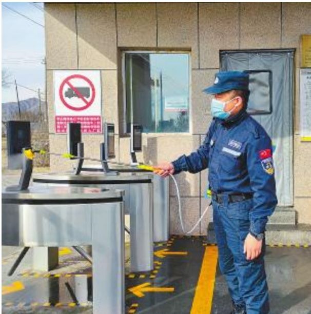
坚持公共区域环境消杀