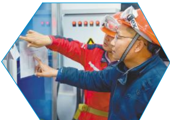
云南通威开展节后安全大检查