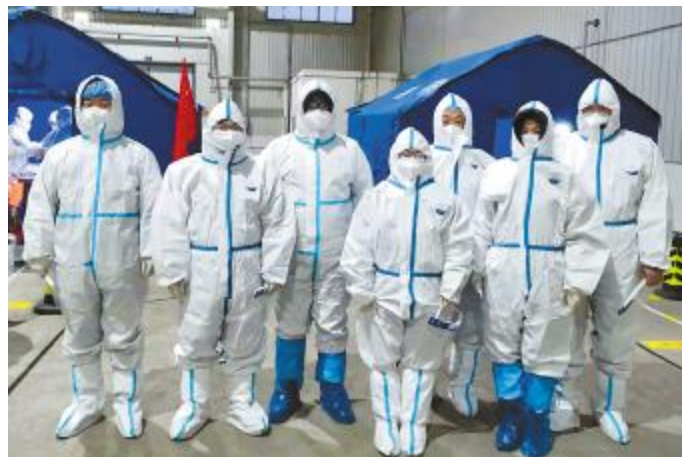
抽调员工参与当地防疫志愿服务