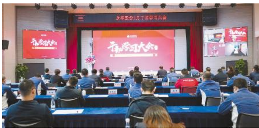
永祥股份召开2月干部学习大会

无论是朝阳初升,还是阴雨绵绵,每一次踏进我们的班组,大家都像又一次回到温暖的“家”。我常常在想,我真的非常幸运能够成为这个班组的一员,因为她能够令我感受到家一般的温馨,也会使我一生受益良多。其实,在我们每个人心里,家是一种责任,只要你成了家中的一员,你就有责任保护好你的家及家人。我们的班组是一个充满责任感使命感的集体,每个人都把自己全部才智和心血无私地奉献,毫无保留。我热爱我平凡的岗位,我爱我的班组、我的“家”。