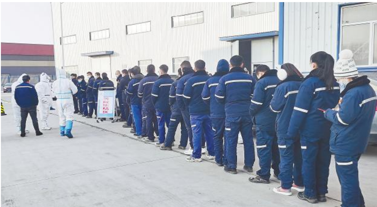
组织员工进行核酸检测