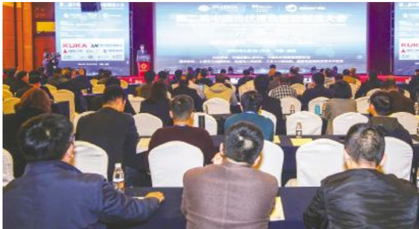
第二届中国光伏绿色智能制造大会现场

奖项的获得不仅是对通威太阳能管理体制的充分肯定,更是对公司在光伏绿色智能制造方面所做出的杰出贡献的充分认可,进一步提升了通威太阳能的品牌影响力和美誉度。未来,通威太阳能将进一步完善一体化运营管理,提高企业综合竞争力,提升产业发展的质量与效益,不断朝着“打造世界级太阳能光伏企业和世界级清洁能源公司”的目标砥砺前行!同期获奖单位还有天合、协鑫、晶科、正泰、腾辉等行业优秀企业。