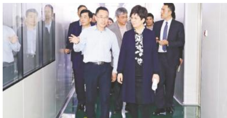
凌云市长一行深入车间调研

走在产业前沿,而通威太阳能作为合肥新能源产业建设的排头兵更要有责任与担当,同时在新项目的建设要注意施工安全和生态环境保护。凌云市长强调,服务好企业、服务好企业家是政府的重要职责。各级政府和部门要经常深入企业走访调研,充分了解企业的痛点和难点,有针对性地制定出台相关扶持政策。合肥市相关部门将全力以赴服务通威太阳能的发展,给予重点帮助和支持,希望通威太阳能再接再厉,再创佳绩!