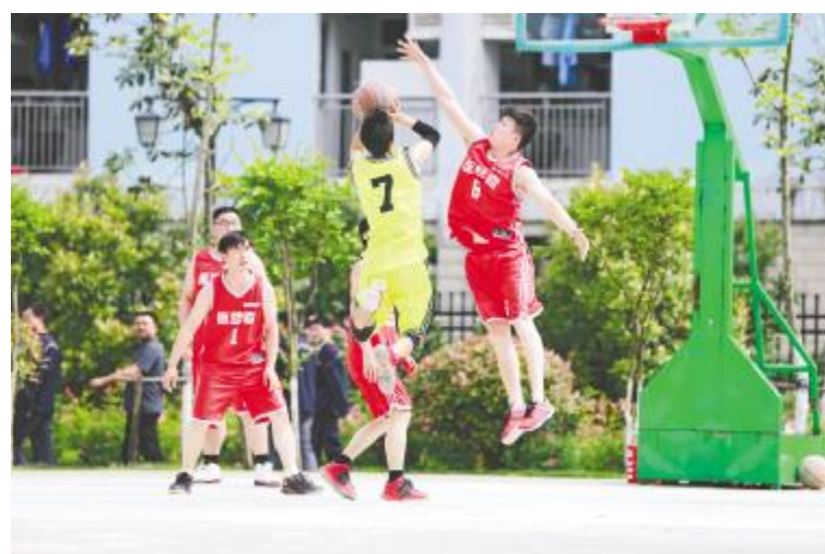
合肥公司比赛现场