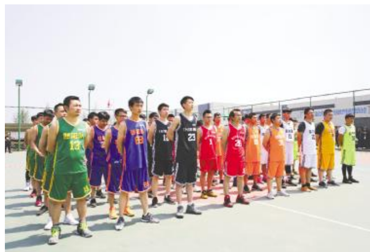
成都公司开赛仪式现场

4月26日,烈日当空,合肥公司的6支队伍迎来首次交锋,现场也同样地紧张激烈。截止4月28日,电池一厂、二厂,厂务部代表队分别赢得1个胜场,决赛将于5月8日举行,是电池二厂代表队第四次捍卫合肥公司第一名,还是其他代表队打破他们的垄断?我们拭目以待!