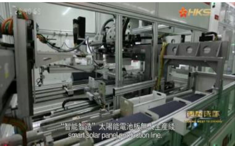
香港卫视报道画面