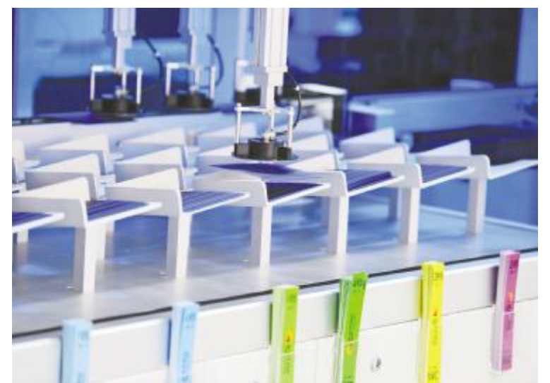
每一片电池片经过严格的测试分选后归类

通威太阳能成都公司始终秉承“追求卓越,奉献社会”的企业宗旨,积极、全面、持续地推进卓越绩效管理,并在文化引领、战略导向、顾客与市场、技术创新等方面有突出表现。此次成功斩获首届