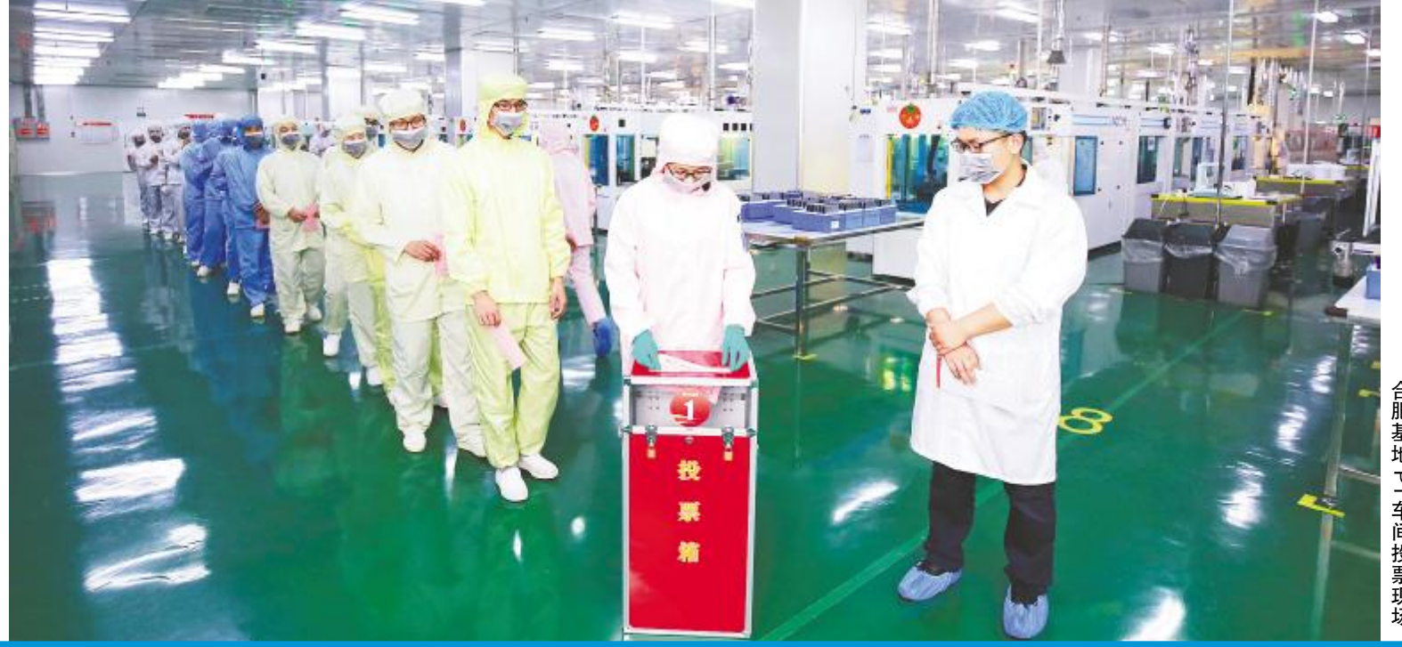
合肥基地生产车间投票现场