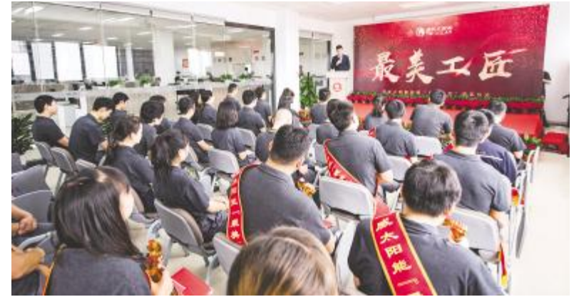
成都基地“最美工匠”评选颁奖仪式现场

此次“最美工匠”评选活动全面面向一线员工,从活动当日开始分组开展票选统计工作,最终评选出两地各10名来自各体系、各部门一线岗位的“最美工匠”,并于五四青年节当天分别在两地举行隆重的颁奖活动。