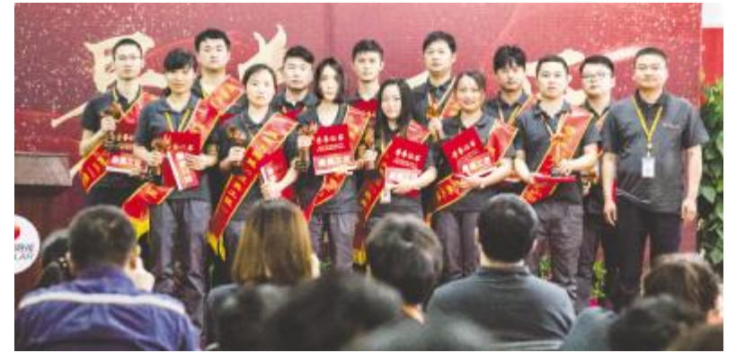
合肥基地获得“最美工匠”荣誉员工合影留念

此次“最美工匠”评选是将工匠精神、创新活力以及通威太阳能企业文化的有机结合。活动的举办在两地公司形成了比学赶超的良好氛围。