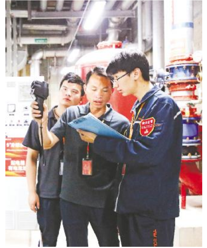
成都基地安全检查人员正在用红外热成像仪测试设备温度