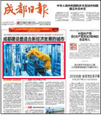
《成都日报》头版头条聚焦通威太阳能

威太阳能作为成都市“无人经济”、高端制造的代表获得了全景式的展现。香港卫视报道画面节目重点展现了通威太阳能无人产线,并指出,在生产领域,成都已经布局了堪称“超级工厂”的通威太阳能无人生产线——世界首条工业4.0高效电池生产线。在这座“超级工厂”