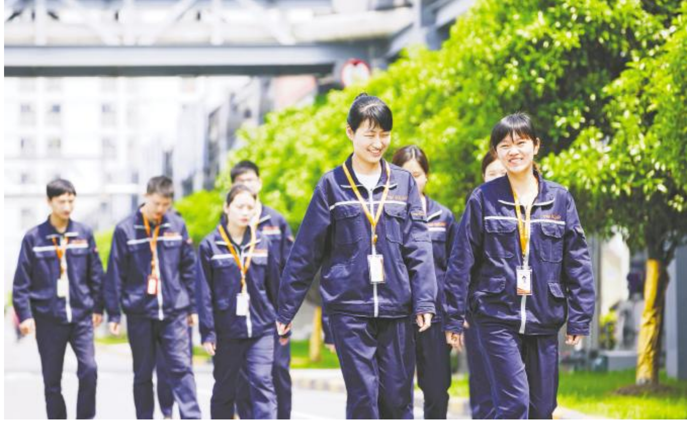
热情似火的青年在通威太阳能挥洒着自己的青春汗水

在通威太阳能,4500名青年正为实现“光伏改变世界”的梦想,在各自岗位奋战拼搏,初心不改。