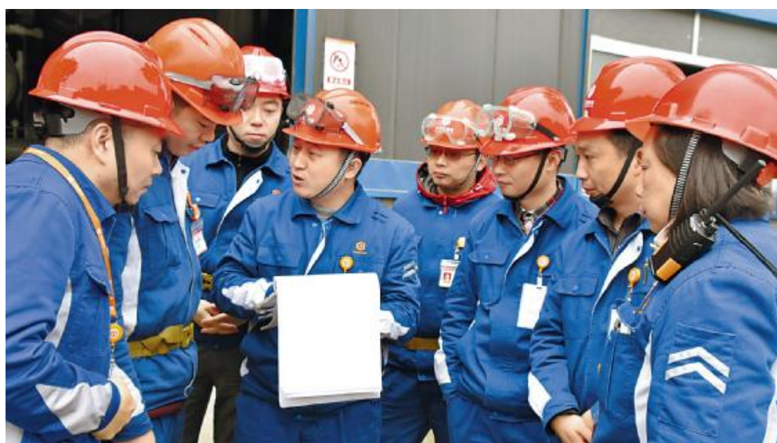
段雍董事长指导永祥多晶硅标准化工作

2017年,数十家主流媒体走进永祥,见证绿色清洁的生产管理和经营发展,陆续进行报道,在行业内外产生了重要影响。《中国环境报》《环境保护》《中国有色金属》《四川日报》《乐山日报》、四川电视台、乐山电视台等主流媒体纷纷点赞永祥。在定期组织的“环保开放日”“家属接待日”等活动