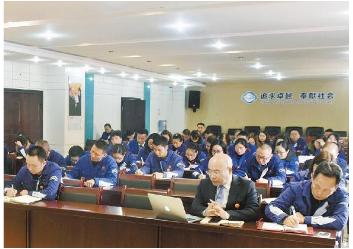
永祥股份本部“扬长砍短 战略聚焦”管理思想学习讨论会现场

“扬长砍短 战略聚焦”思想提出后,永祥股份随即掀起了一股学习热潮,从永祥股份本部到各部门、从各子公司到生产一线的车间、工段,大家结合各自岗位,认真讨论,凝心聚力,不断自我提升、进步。