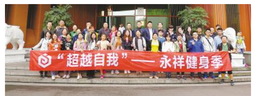
寓教于乐,永祥股份积极开展团队活动

今年,永祥股份还不断拓宽员工学习维度,于10月推出通威永祥在线学习平台,打破了企业传统的培训模式,紧跟时代潮流,投入大量人力、财力,打造网络学习平台。从此,永祥人有了自主学习、考试、提升的在线渠道,能有效利用碎片时间,实现个人、整体的成长与突破。