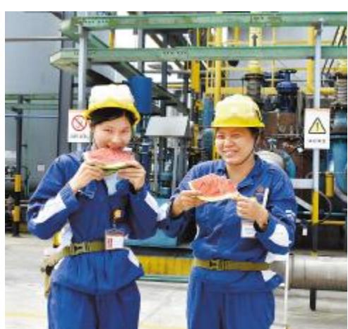
夏季送清凉,让员工感受家一般的温暖

值得一提的是,独具特色的永祥爱心拍卖会。作为永祥今年新增的特色文化活动,已开展两期。员工拿出自己的“小收藏”现场拍卖,拍卖所得全部纳入永祥关爱基金,作为帮扶和慰问困难员工资金使用,据悉,两次拍卖活动筹得善款超2万。整个活动既有趣,又充满正能量,体现出了永祥大家庭的浓浓温情。