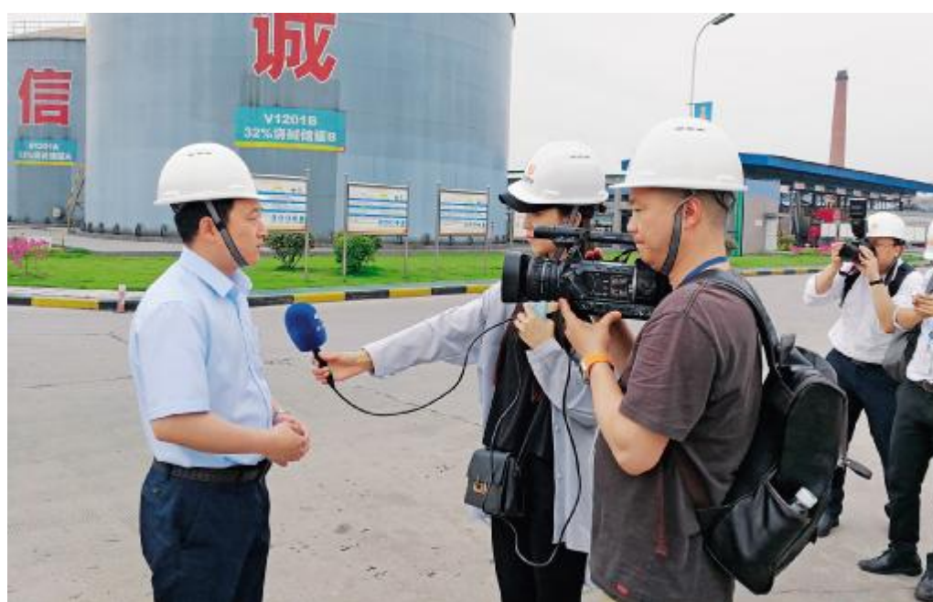
5月24日,权威主流媒体走进永祥,对外展现永祥风采

永祥股份一直以来高度重视企业文化建设,以文化为引领,不断推动管理提升、标准化升级。尤其在今年,永祥股份进一步弘扬“像家庭、像学校、像军队”文化特色,同时积极传递绿色环保企业理念,取得良好成绩。