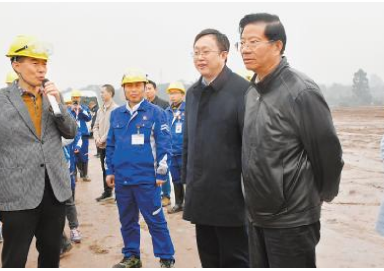
四川省人大常委会副主任彭渝、乐山市市委书记彭琳调研永祥位于乐山的 5 万吨高纯晶硅及配套新能源项目建设

通过实地调研和听取汇报, 彭渝副主任一行高度评价了永祥新能源的发展成绩和项目施工现场的管理, 对永祥新能源项目充分利用区域资源, 大力推广新技术、新工艺, 打造世界级绿色清洁能源企业的目标给予了肯定。希望永祥新能源再接再厉, 加快项目推进, 建出精品工程, 打造具有永祥特色的“绿色硅谷”, 为地方经济发展再立新功。