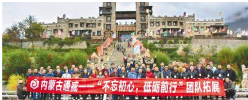
内蒙古通威高纯晶硅开展团队拓展

自2017年9月开工以来,在集团总部、永祥股份领导关怀下,在包头市、昆区各级领导大力支持和协调下,在公司项目部全体员工的共同努力下,紧锣密鼓抓进度,一丝不苟抓质量和安全,取得了多个装置区建设全面开花,齐头并进的局面。工程组各专业技术人员争分夺秒,挑灯夜战。在确保安全的前提下,仅用了原计划一半的时间就完成了项目各装置区中浇筑难度最大的一处混凝土浇筑工作,取得了一场攻坚战完美胜利。目前多个装置区基础建设超前完成工期节点进度计划。