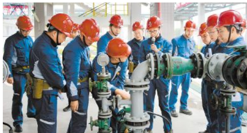
永祥树脂组织员工走进标准化示范岗位学习交流

11月,永祥树脂各部门、车间就员工安全生产职责进行全面贯彻并督促落实到位。各部门、车间管理人员着重强调化工生产过程中存在的各种不安全因素和职业危害,要求所有操作人员必须熟悉和掌握相关的安全知识和事故防范措施,并具备一定的安全事故处理技能。生产操作过程中严格遵守公司各项安全管理规章制度,不违章作业,不冒险作业,不违反操作规程。