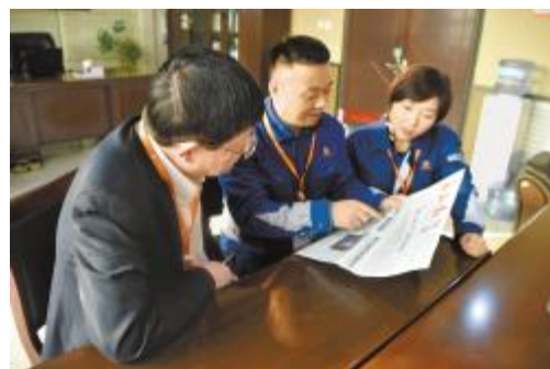
永祥股份员工积极学习讨论“扬长砍短 战略聚焦”思想