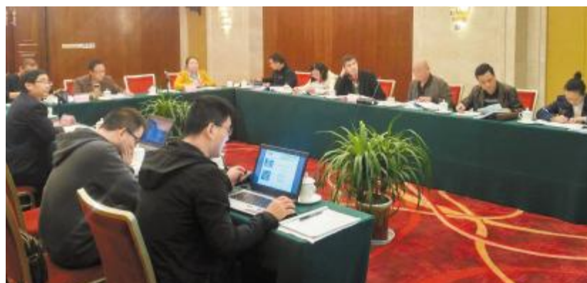
永祥新能源高纯晶硅一期项目顺利通过节能评估