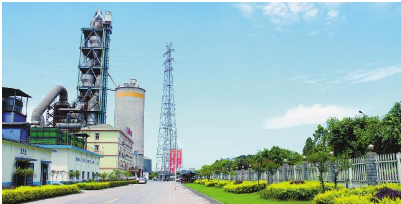
绿色环保的永祥水泥厂区