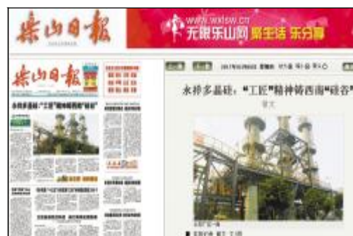
《乐山日报》头版头条聚焦永祥多晶硅发展