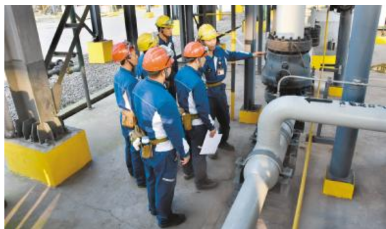
永祥多晶硅各部门及各工段积极开展对标学习活动

期间,像“碱液搅拌罐刻度不清晰,增加刻度线标识”“702真空泵区域增加围栏”“在重要开关柜上贴上红色醒目标识便于应急操作时辨认”等小创新、小发明和小改革的建议越来越多,众人拾柴火焰高,永祥员工身体力行践行着“团结协作,共谋发展”的文化理念以及“追求卓越,奉献社会”的企业宗旨。