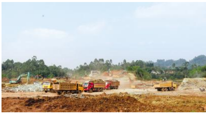
乐山 5 万吨高纯晶硅及配套新能源项目建设现场